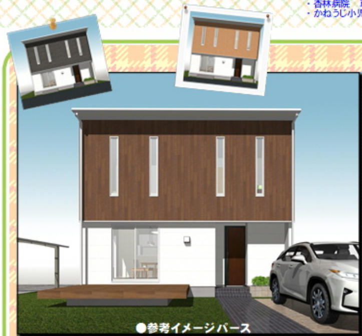
●参考イメージパース